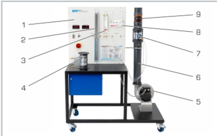
1 Schaltschrank mit Anzeigeelementen, 2 U-Rohr-Manometer, 3 Rohrmanometer, 4 Venturidüse, 5 Radialgebläse mit Ansaugstutzen, 6 Rohrstrecke, 7 Irisblende, 8 Schrägrohrmanometer, 9 Drosselklappe