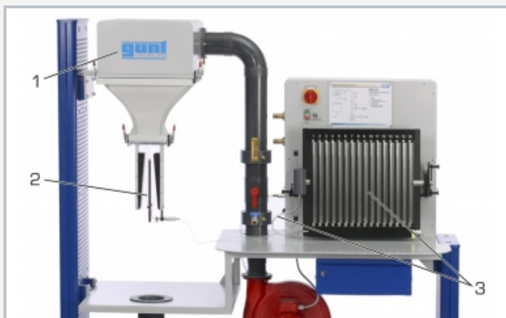
Structure de l'essai: 1 HM 225, 2 HM 225.02, 3 manomètre à tubes (HM 225) utilisé en liaison avec HM 225.02