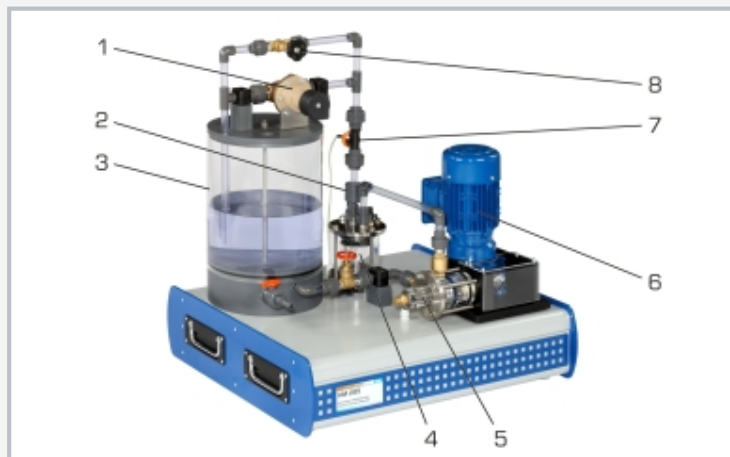
1 soupape de décharge, 2 capteur de pression à la sortie, 3 réservoir d'eau, 4 réservoir à air, 5 pompe à piston, 6 moteur, 7 capteur de débit, 8 soupape à pointeau pour l'ajustage du débit