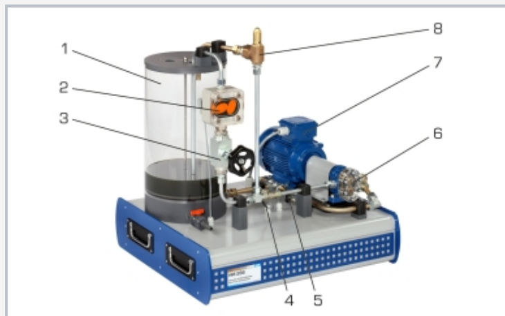
1 réservoir, 2 capteur de débit (débitmètre à roue ovale), 3 soupape à pointeau, 4 capteur de pression à la sortie, 5 capteur de pression à l'entrée, 6 pompe à engrenages, 7 entraînement, 8 soupape de décharge pour l'ajustage de la hauteur de refoulement