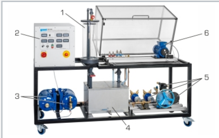
1 réservoir de mesure, 2 éléments d'affichage et de commande, 3 réservoir de stabilisation et réservoir sous pression, 4 réservoir de stockage, 5 pompes et compresseur, 6 moteur d'entraînement