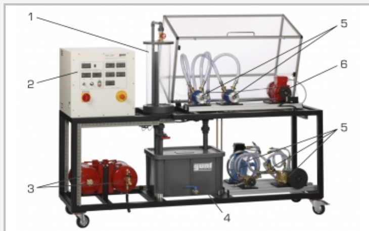
1 réservoir de mesure, 2 éléments d'affichage et de commande, 3 réservoir de stabilisation et réservoir sous pression, 4 réservoir de stockage, 5 pompes et compresseurs, 6 moteur d'entraînement