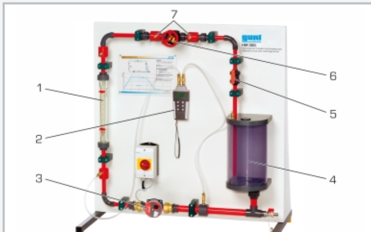
1 débitmètre, 2 appareil de mesure de la pression, 3 pompe, 4 réservoir, 5 soupape d'étranglement, 6 soupape à diaphragme, 7 points de mesure de la pression