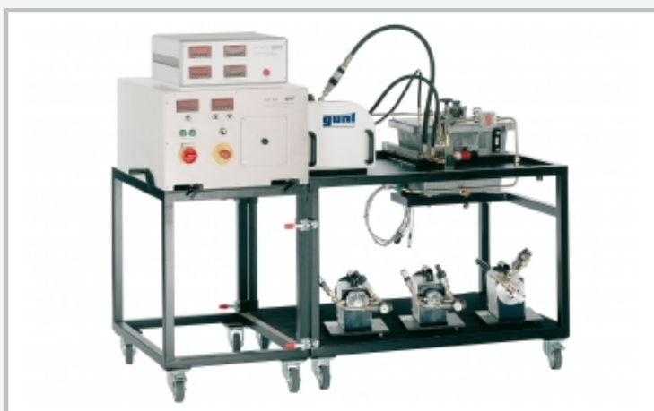
Montaje experimental funcional: unidad de accionamiento HM 365 (izquierda), HM 365.20 con la bomba que se va a estudiar (derecha)