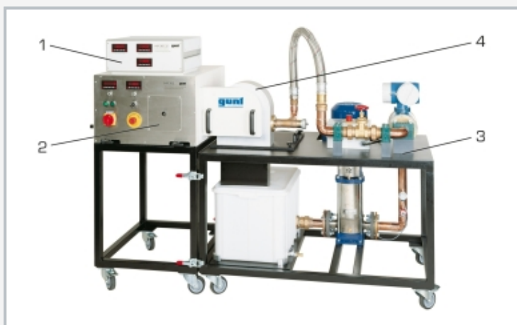
1 amplificador de medición con indicador digital de los valores de medición, 2 unidad de accionamiento y frenado universal HM 365, 3 HM 365.32, 4 turbina Pelton y turbina Francis HM 365.31