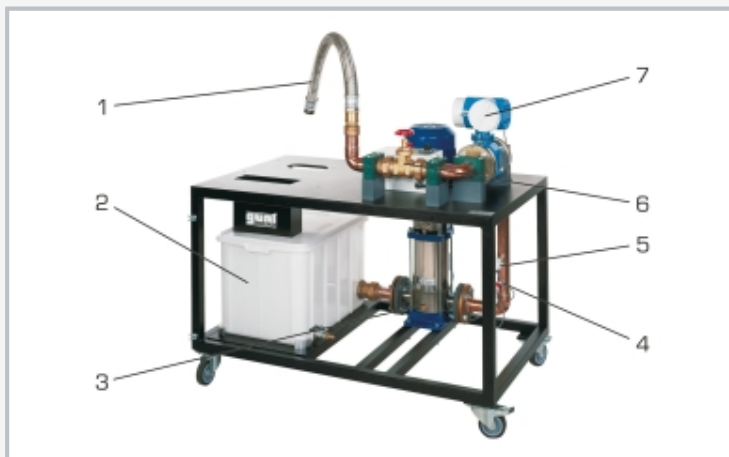
1 turbina de la entrada de agua, 2 depósito, 3 bomba centrífuga, 4 punto de medición de presión, 5 punto de medición de temperatura, 6 válvula de estrangulación, 7 caudalímetro