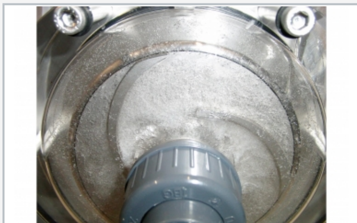
Formación de burbujas de vapor por cavitación en el rodete de la bomba