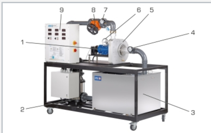
1 machine asynchrone, 2 pompe, 3 réservoir, 4 affichage de la pression à la sortie de la turbine, 5 turbine, 6 ajustage des aubes directrices, 7 affichage de la pression à l'entrée de la turbine, 8 soupape d'étranglement, 9 armoire de commande avec éléments d'affichage et de commande