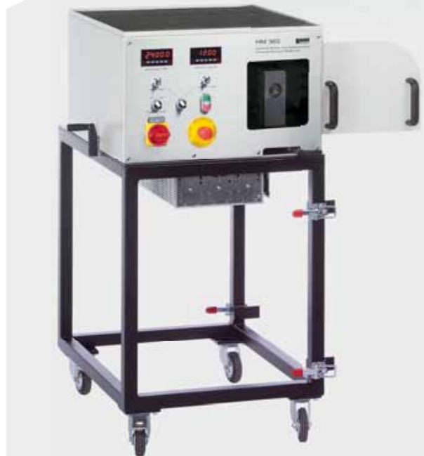
HM 365 Unidad universal de accionamiento y frenado