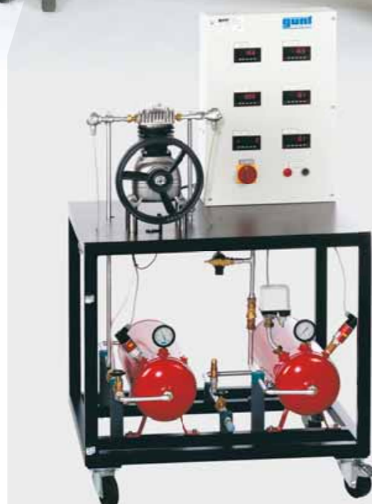
ET 513 Compresor de émbolo de una etapa

Los compresores de émbolo transportan fluidos comprimibles como gas o aire.