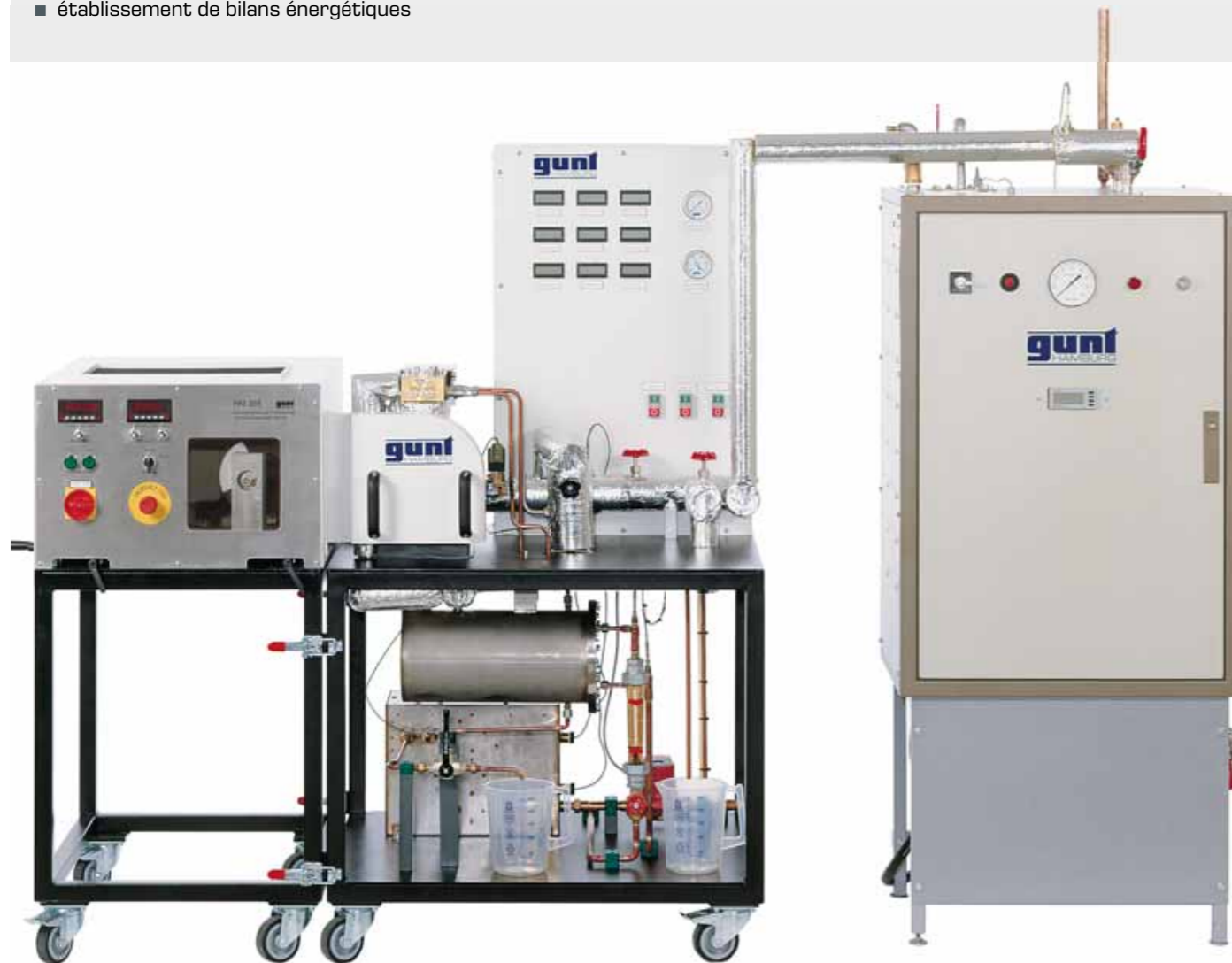
HM 365 Dispositif de freinage et d'entraînement universel