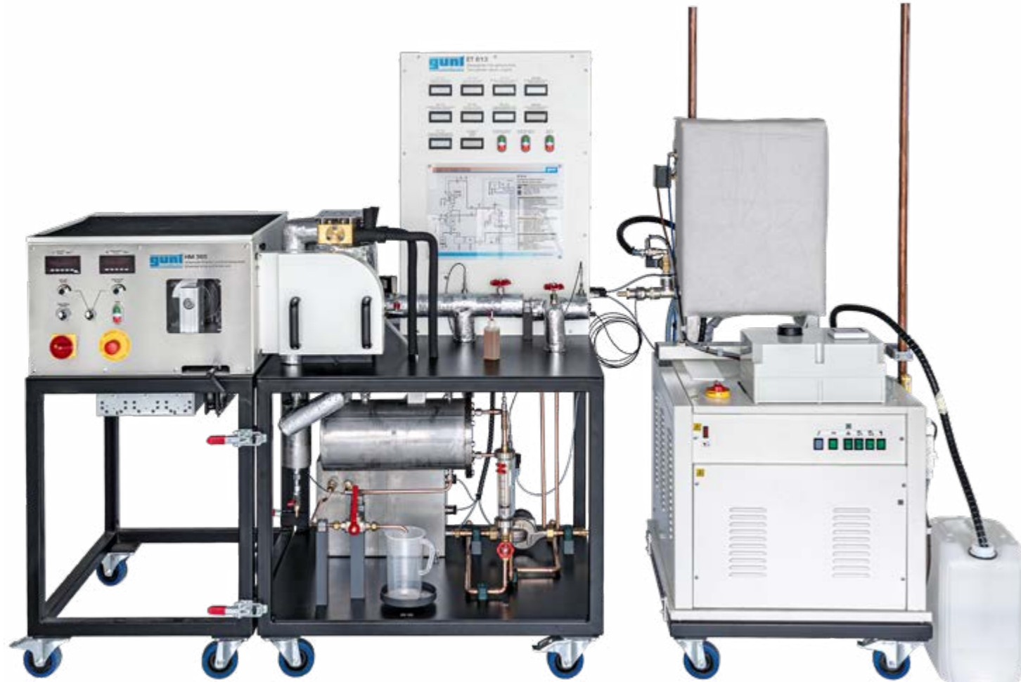
HM 365 Unidad universal de accionamiento y frenado