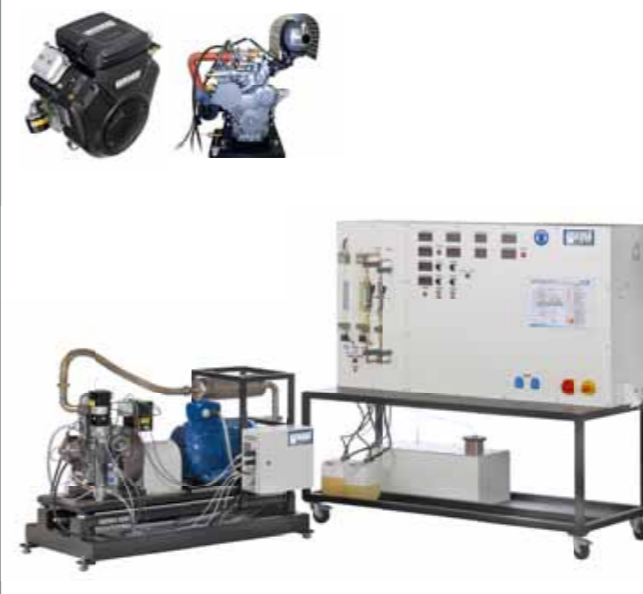
CT 300 Banc d'essai pour moteurs, 11 kW