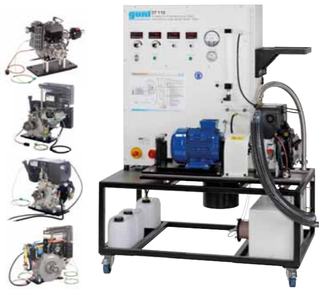
CT 110 Banc d'essai pour moteurs monocylindres, 7,5 kW