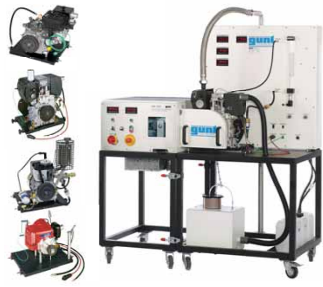
CT 159 Banc d'essai modulaire pour moteurs monocylindres, 3,0 kW