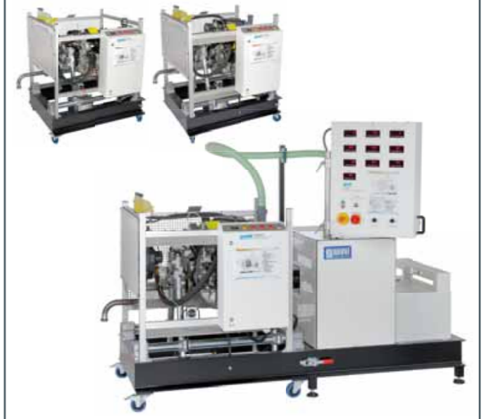
CT 400 Unité de charge, 75 kW, pour moteurs quatre cylindres